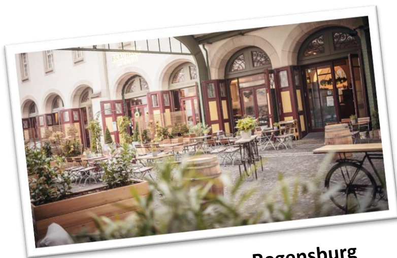
Brauhaus am Schloss - Regensburg