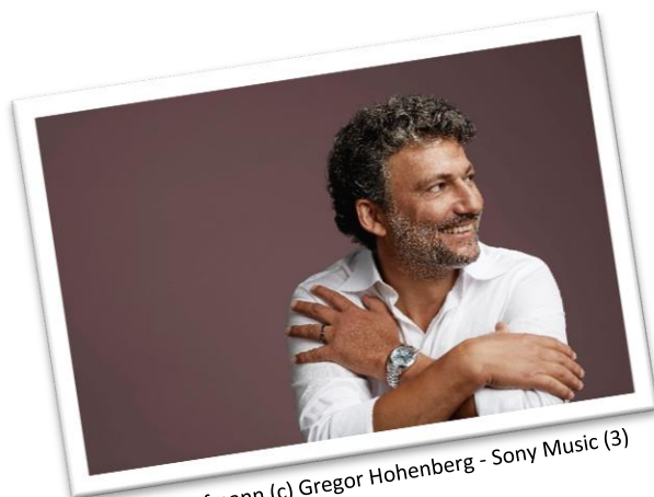
Jonas Kaufmann